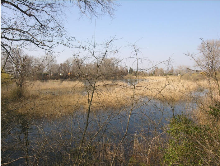
Kiesgrube mit Friedrichsteich - Friedrichsteiche; Blick N