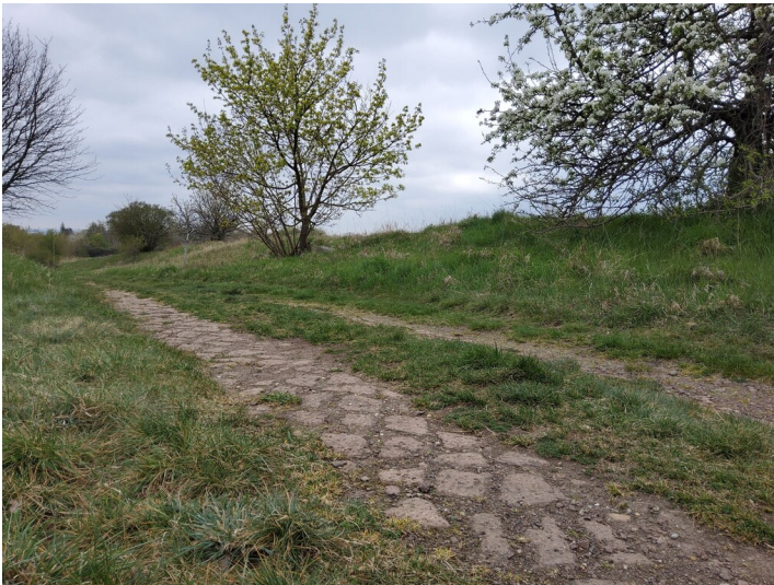
Werkstraße der Grube Carl Ernst (Karl-Ernst-Straße) - Das östliche Ende des Karl-Ernst-Weges