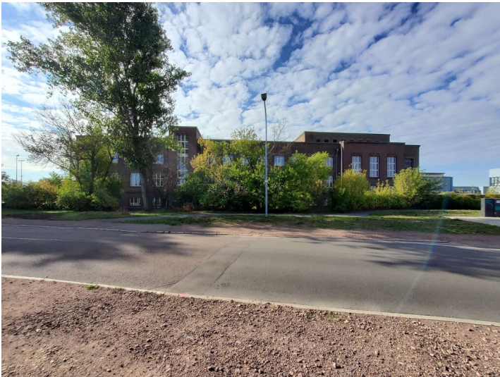
Kraftwerk Trotha - Ansicht Ost