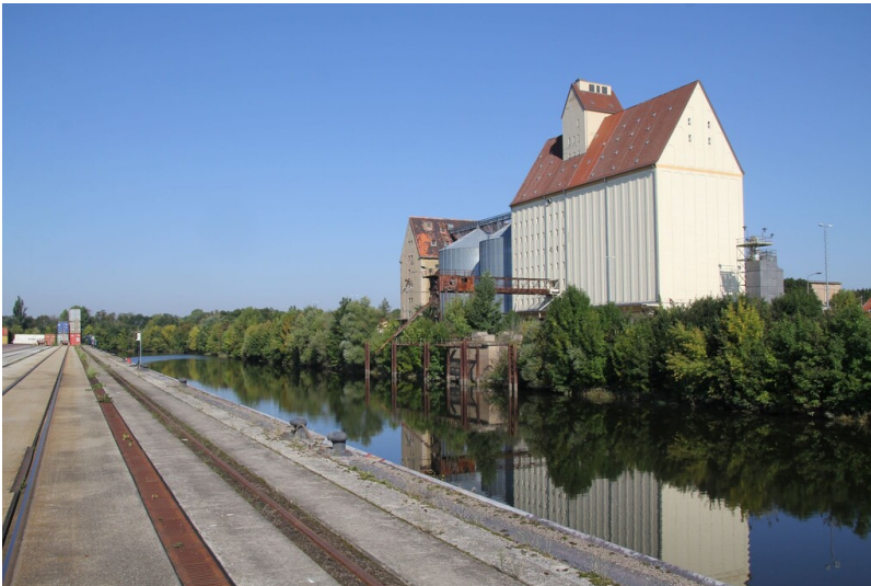
Hafen Trotha Fotograf/Urheber: NAME FEHLT

Schlagwörter: Hafen Fachsicht(en): Denkmalpflege Gemeinde(n): Halle (Saale) Kreis(e): Halle (Saale) Bundesland: Sachsen-Anhalt