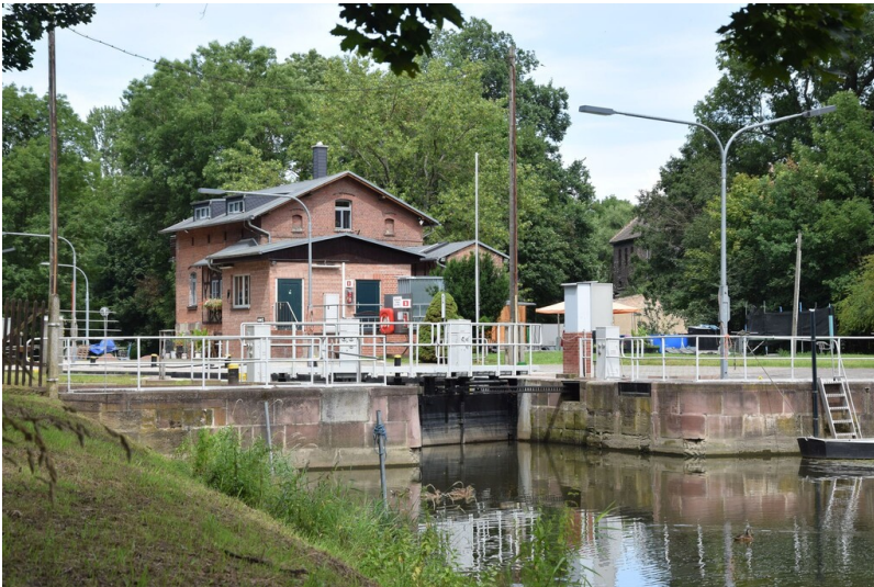
Schleuse Trotha - Schleusenwärterhaus mit Einfahrt zur Schleuse