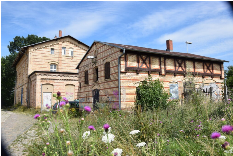
Bahnhof Trotha - Straßenansicht des Bahnhof Trotha