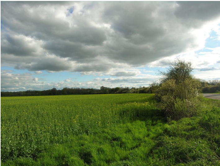
Schacht, Tagesanlage und Seilbahnverladung des Christoph Friedrich Schacht - Situation an Stelle des ehemaligen Schachtes mit Seilbahnstation; Blick S

Schlagwörter: Tagesanlage Fachsicht(en): Denkmalpflege Gemeinde(n): Halle (Saale) Kreis(e): Halle (Saale) Bundesland: Sachsen-Anhalt