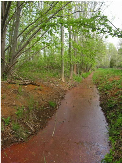
Rösche der Grube Glückauf - Entwässerungsgraben der Grube Glückauf; Blick NE