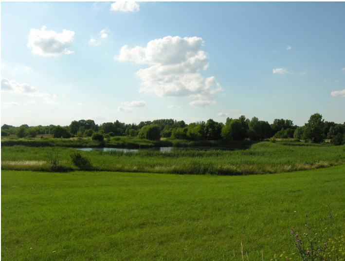
Tagebau der Grube Glückauf - die Tagebaugrube, das Restloch mit dem Trothaer Teich; Blick NW