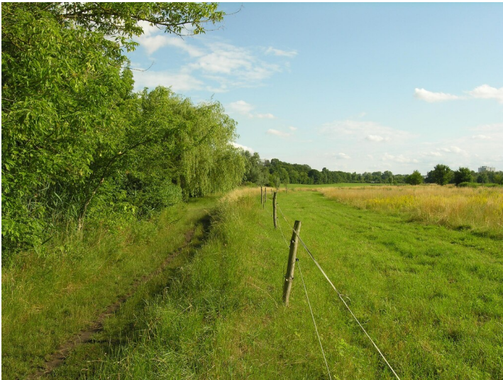
Kohlebahn der Grube Glückauf - auf dem Damm der ehemaligen Kohlebahn; Blick S