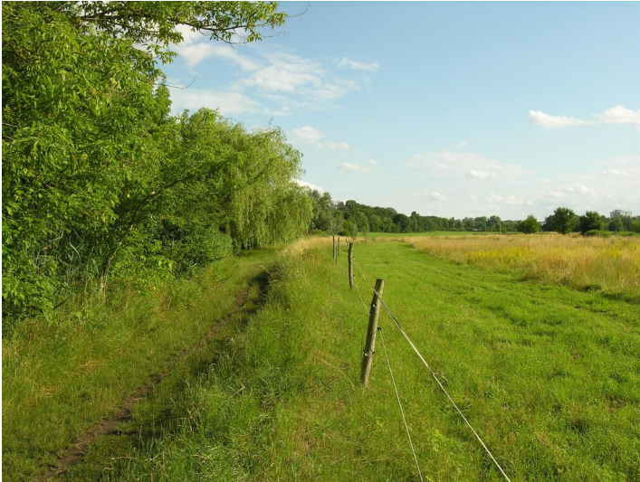
Kohlebahn der Grube Glückauf - auf dem Damm der ehemaligen Kohlebahn; Blick S