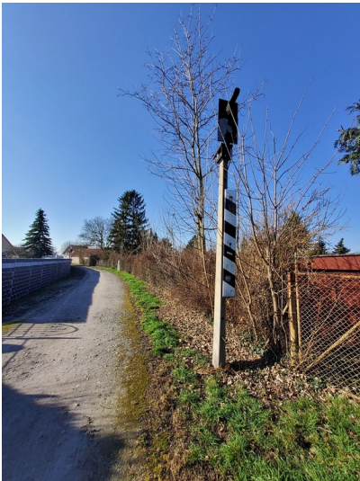
Eisenbahnanschluss Zementfabrik - Grube Neuglück - Bahnhof Nietleben - Erhaltene Signalanlage an der Strecke