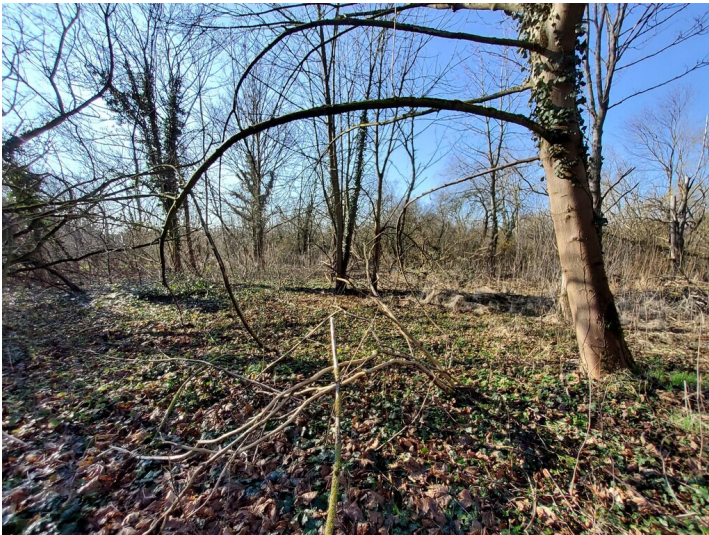
Fabriken der Grube Neuglück - Situation des ehemaligen Fabrikgeländes