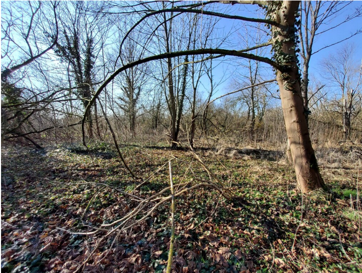
Fabriken der Grube Neuglück - Situation des ehemaligen Fabrikgeländes