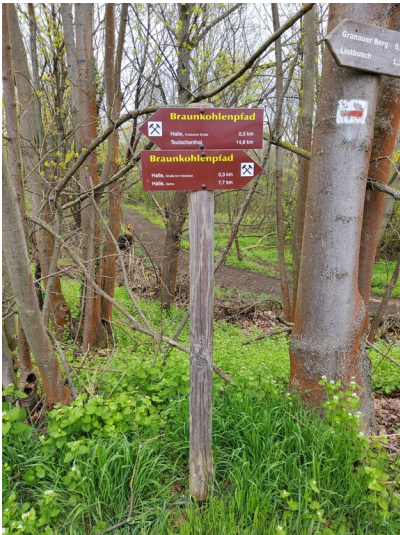
Infotafel Braunkohlenpfad - Wegweiser am Standort