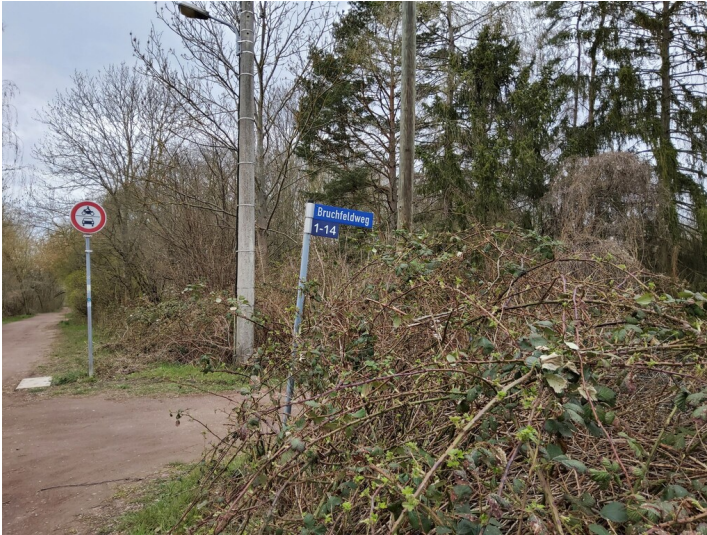
Straßenname Bruchfeldweg - Straßenschild am südlichen Ende