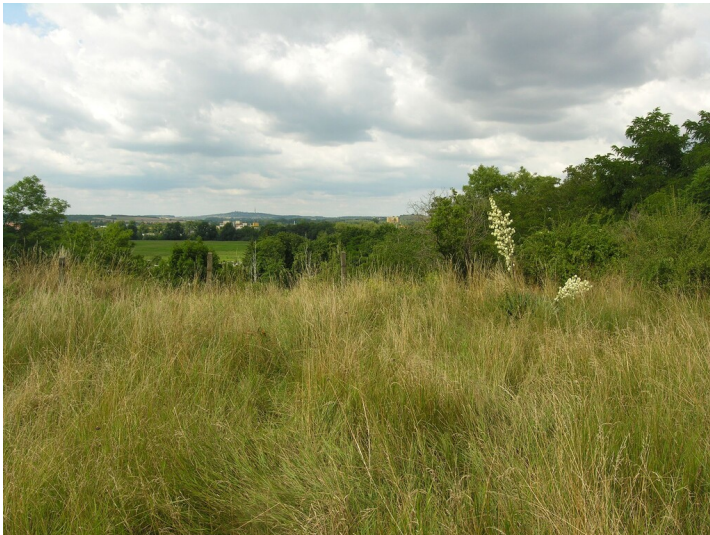
Aschehalde der Papierfabrik Kröllwitz - auf der Aschehalde; Blick zum Hafen Trotha; Richtung NE