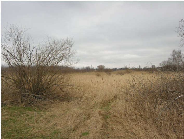
Abbaufeld mehrerer Gruben - abgesenktes Areal mit Feuchtwiesen; Blick N