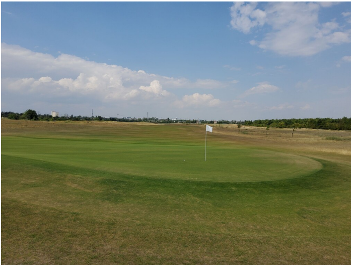
Tagebau Bruckdorf Nord - Kann man ein bergbaubedingt welliges Gelände besser nutzen als als Golfplatz?