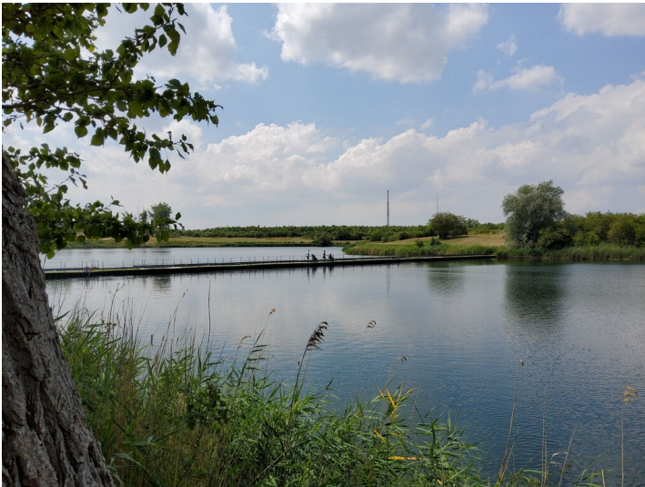
Hufeisensee - Fußgängerbrücke für Golfende über den Hufeisensee, schmalste Stelle der westlichen Hälfte des Hufeisensees