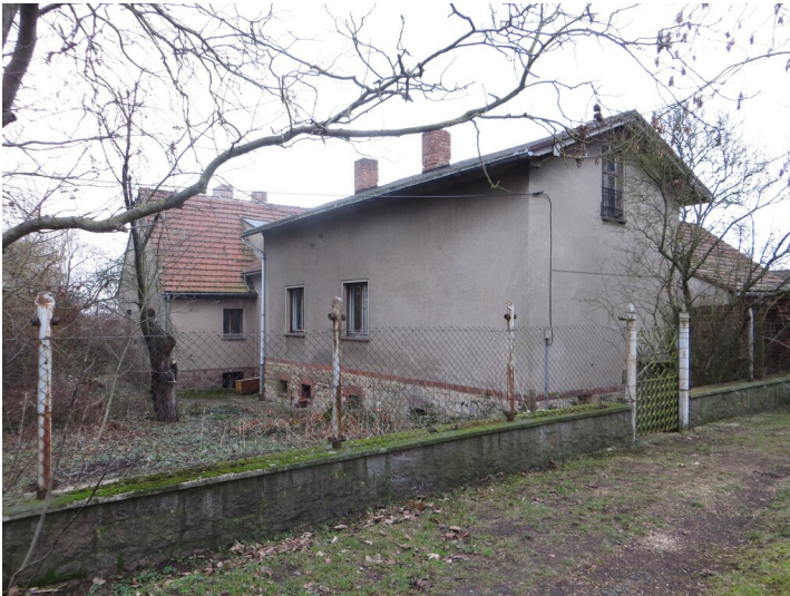
Steigerhaus der Grube Alt-Zscherben - Steigerhaus, Blick in Richtung Südwesten