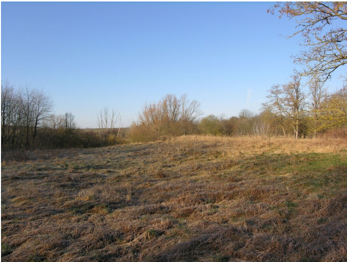
Schacht, Tagesanlagen und Fabrik Grube Alt-Zscherben - im Bereich des wiederverfüllten Geländes an Stelle ehemaliger Fabrik; Blick NW