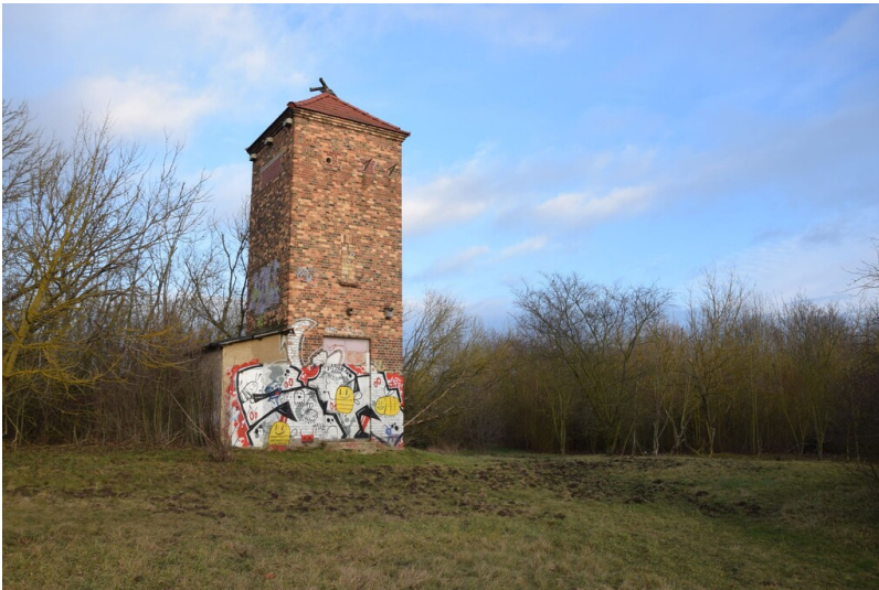
Trafostation - Transformatorstation, aufgenommen aus südöstlicher Richtung

Schlagwörter: Transformator Fachsicht(en): Denkmalpflege Gemeinde(n): Halle (Saale) Kreis(e): Halle (Saale) Bundesland: Sachsen-Anhalt