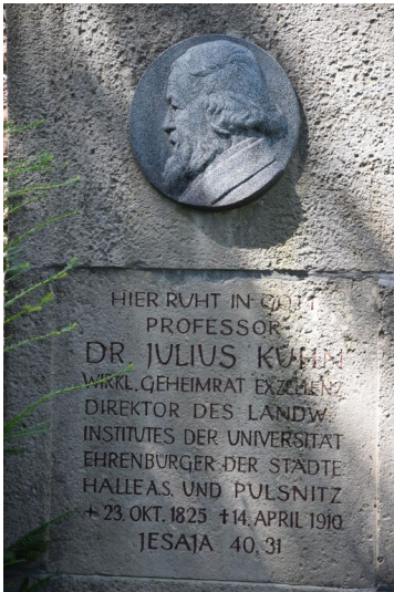
Grabmal Julius Kühn und Familie - Grabmal des Herrn Dr. Julius Kühn