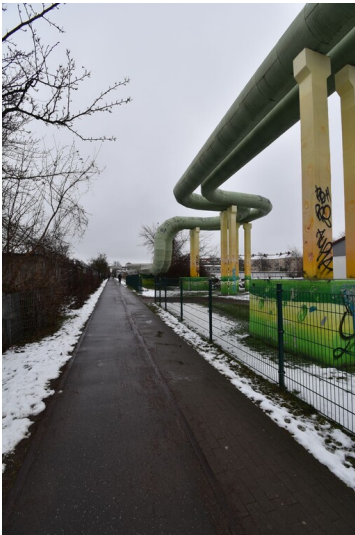
Hallesche Hafenbahn - Ansicht ehemaliger Verlauf der Hafenbahn an der Turmstraße