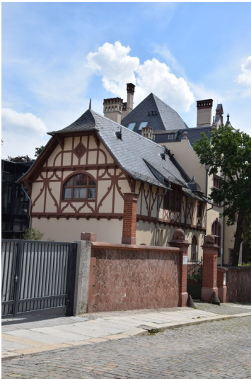
Villa Riedel - Straßenseite Rückansicht