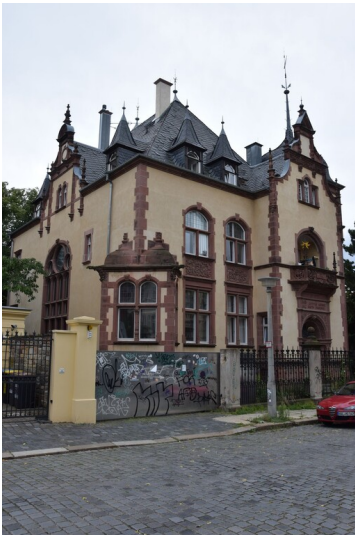
Villa Weise - Straßenansicht der Villa Weise