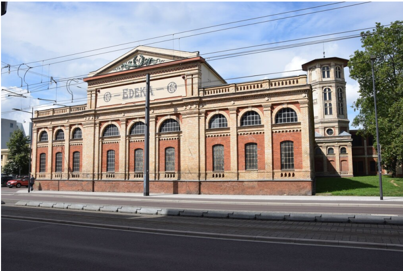
Maschinenbau AG Wernicke - Straßenansicht