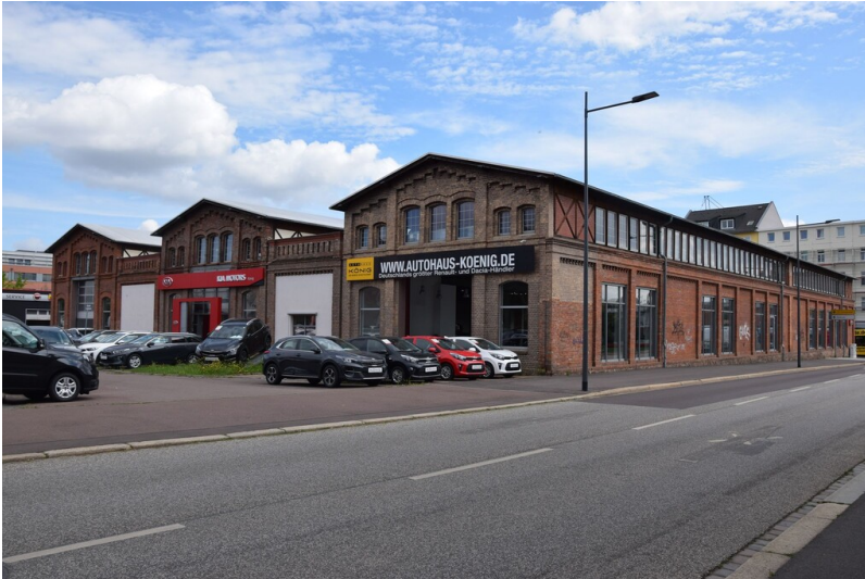
Maschinenfabrik Riedel & Kemnitz - Straßenansicht der ehemaligen Maschinbaufabrik