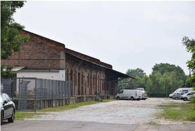
Thüringer Güterbahnhof - Ansicht des ehemaligen Bahnhofsgebäude des Thüringischen Bahnhofs; backsteinsichtiger, eingeschossiger Bau mit flachem Satteldach.