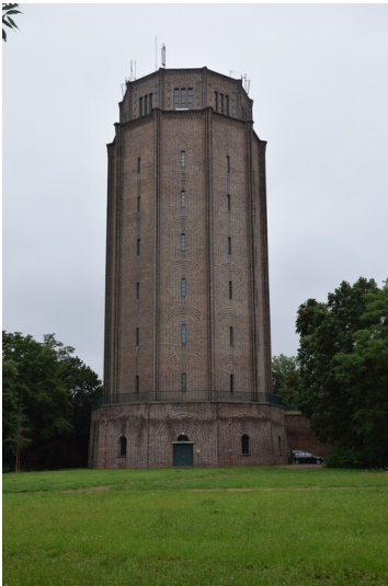
Wasserturm Süd / Umspannwerk - Wasserturm am Lutherplatz