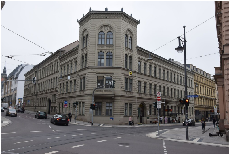
Hotel Stadt Hamburg - Straßenansicht des ehemaligen Hotels und heutige Institutsgebäude