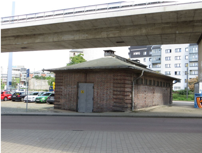
Trafostation Moritzzwinger - südliche Ansicht der ehemaligen Transformationsstation