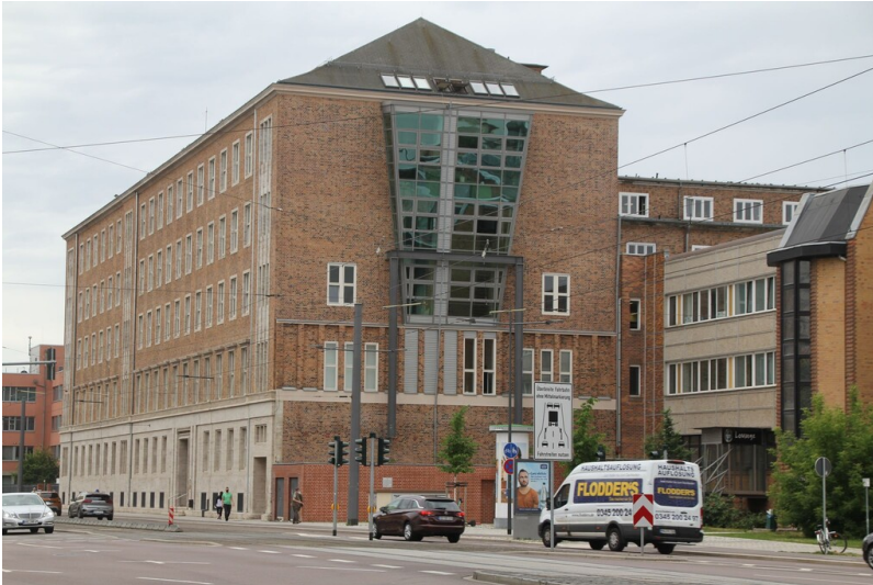
IG Farben Bergbauverwaltung - Straßenansicht der ehemaligen IG Farben Bergverwaltung