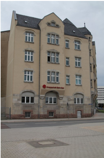
Hallescher Knappschafts-Verein - Straßenansicht des Verwaltungsgebäude der Halleschen Knappschaft