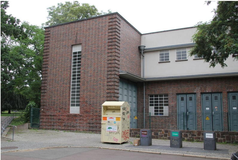
Umspannwerk Dorotheenstraße, Umspannwerk Stadtpark