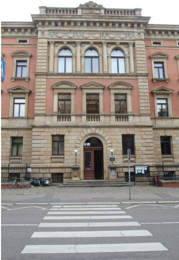
Ehemaliges königlich-preußisches Oberbergamt - Eingangsbereich des ehemaligen Oberbergamts in Halle (Saale)