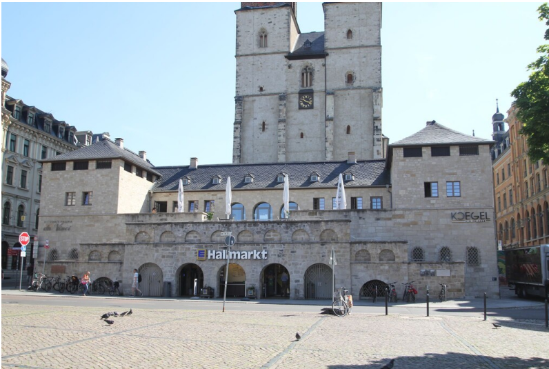
Umspannwerk Hallmarkt

Schlagwörter: Umspannwerk Fachsicht(en): Denkmalpflege Gemeinde(n): Halle (Saale) Kreis(e): Halle (Saale) Bundesland: Sachsen-Anhalt