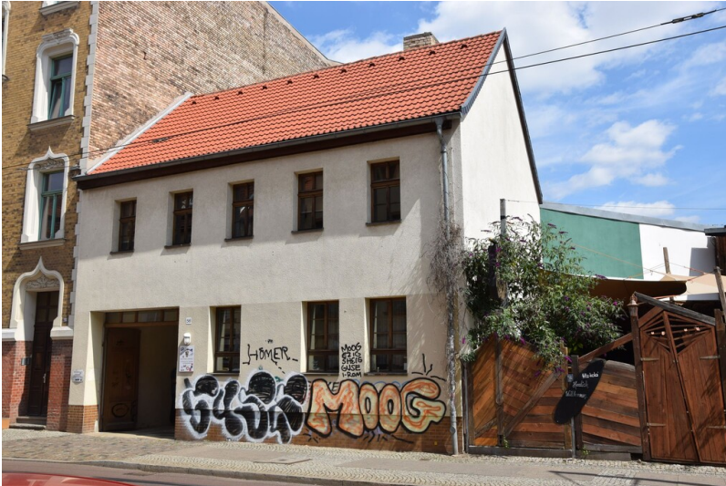
Zweigstelle Landesamt für Geologie und Bergwesen - Straßenansicht der ehemaligen Zweigstelle des Landesamtes für Geologie und Bergwesen