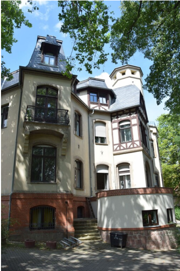
Brummesche Villa - Straßenseitige Aufnahme der ehemaligen Villa des Zuckerfabrikanten Brumme