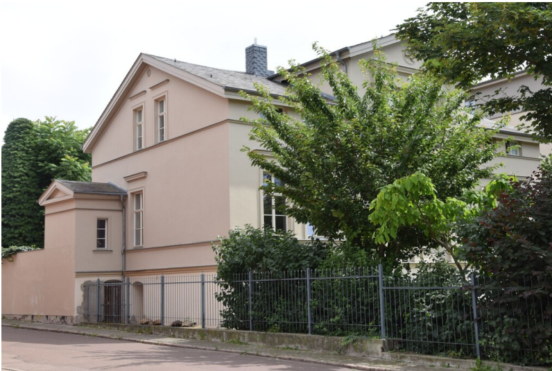
Villa Leutert - Seitenansicht