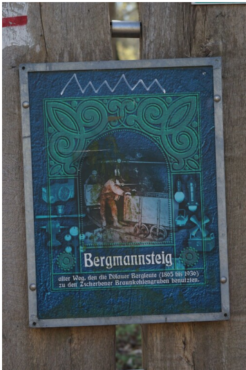
Bergmannsteig - Hinweisschild mit Graffiti zum sogenannten Bergmansteig, der durch die Döhlauer Heide zur Grube Neuglück führte.