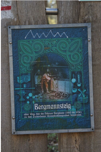
Bergmannsteig - Hinweisschild mit Graffiti zum sogenannten Bergmansteig, der durch die Döhlauer Heide zur Grube Neuglück führte.