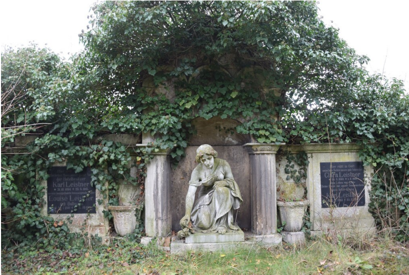
Friedhof Dölau - Grabmal Familie Leistner, an der westlichen Friedhofsmauer gelegen