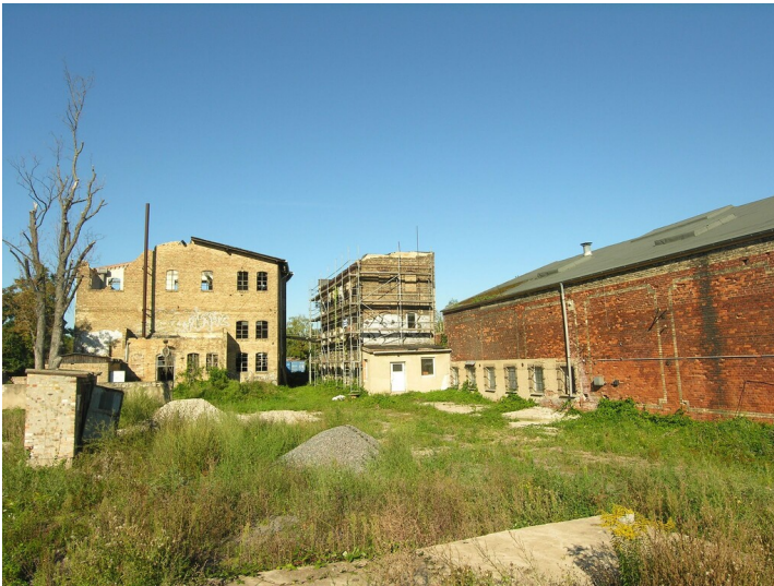
Schachtanlagen und Fabriken der Grube von der Heydt