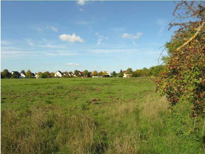
Erster Tagebau der Grube von der Heydt - Situation der ersten Tagebaugrube; westlich der Osendorfer Kippe; Blick N