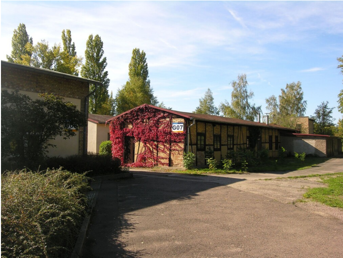
Werkstattgebäude der Großtagebaue von der Heydt und Bruckdorf - ein Lagergebäude; Blick W