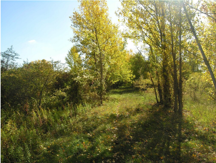
Abfallhalde der Radeweller Papierfabrik - Situation an Stelle ehemaliger Halde; Blick SE