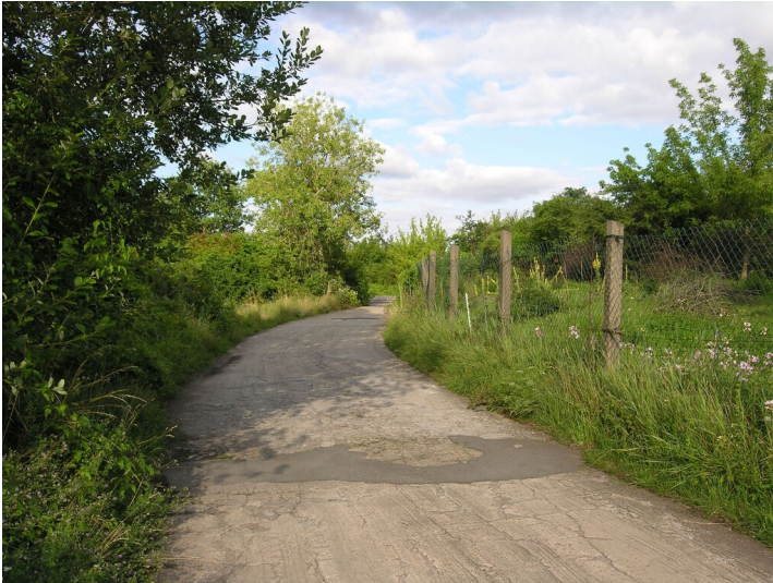
Abfallhalde der Fabriken Grube von der Heydt - Weg am nördlichen Rand der Halde; Blick E