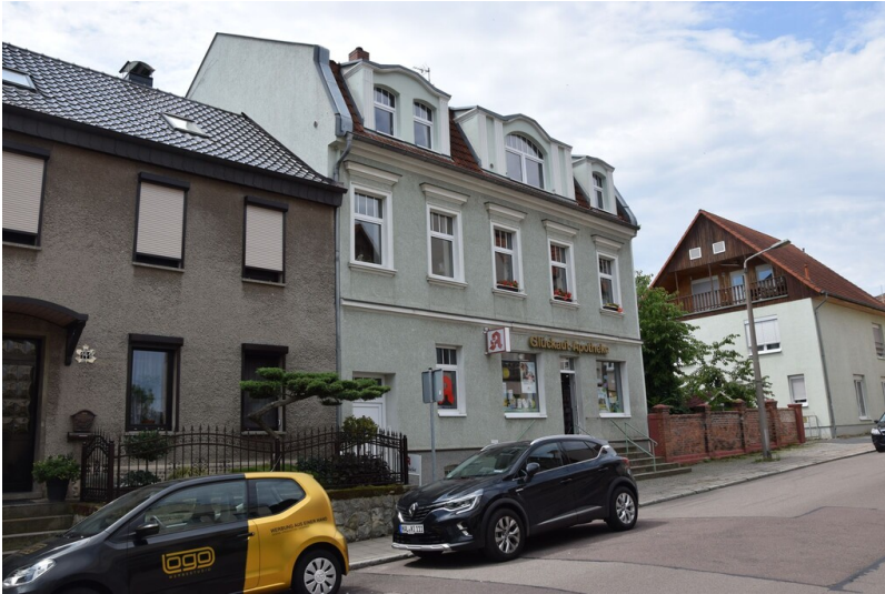
Glückauf-Apotheke Ammendorf - Straßenansicht der ""Glück Auf"" Apotheke