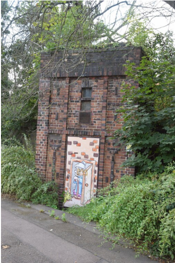
Transformatorstation Ammendorf/Beesen - Straßenansicht der ehemaligen Transformatorstation