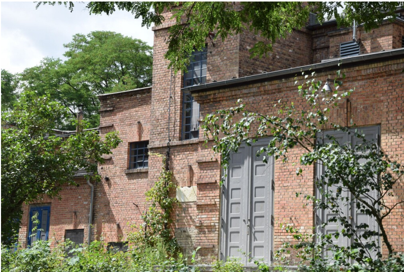
Umspannwerk Am Tagebau - Straßenansicht des ehemaligen Umspannwerks